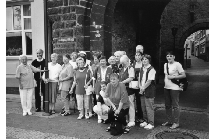
Teilnehmer der Seminarfahrt 2001

Untergebracht waren wir in einem Hotel in Andernach. In diesen Tagen haben wir ein Weingut besichtigt und unsere Reiseleitung zeigte uns die Festung Ehrenbreitstein. Von hieraus hatten wir eine schöne Aussicht auf das Deutsche Eck. Ein besonderes Erlebnis für uns alle war auch die Besichtigung der Drosselgasse in Rudesheim. Auch dieses Wochenende haben wir in guter Erinnerung behalten.